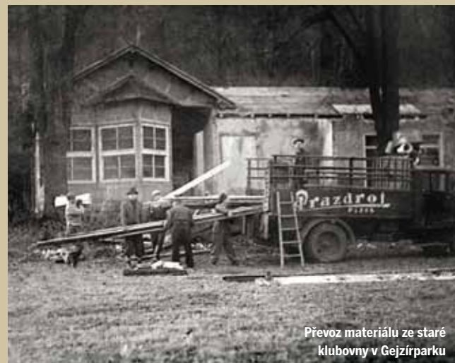
Převoz materiálu ze staré klubovny v Gejzírparku