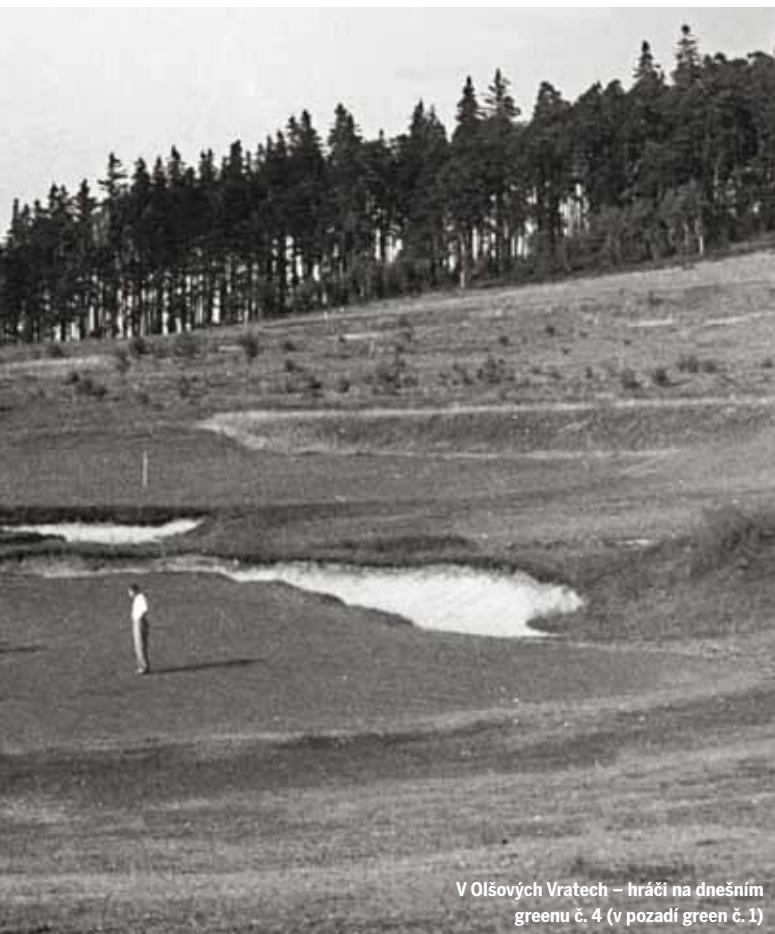
V Olšových Vratech – hráči na dnešním greenu č. 4 (v pozadí green č. 1)