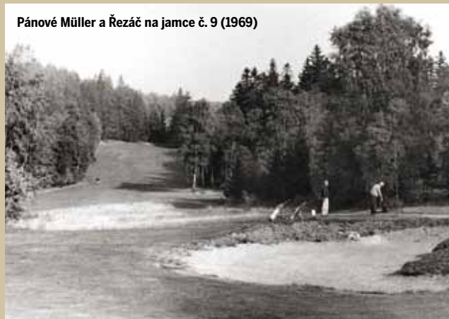
Pánové Müller a Řezáč na jamce č. 9 (1969)