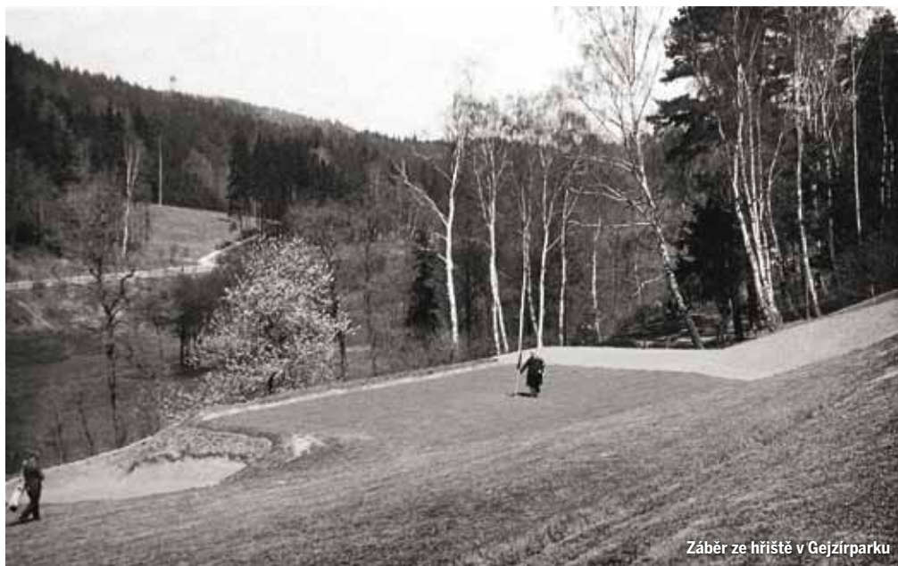
Záběr ze hřiště v Gejzírparku

u Olšových Vrat na brambořiště, ale ztroskotal i další pokus přimět jiného vybraného předsedu golfu, aby sestavil pracovní výbor. Mezitím klubovna na dolním hřišti pustla