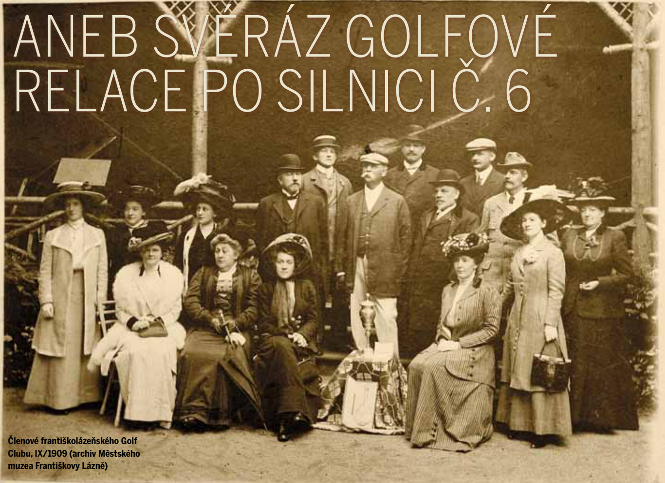
Členové františkolázeňského Golf Clubu, IX/1909