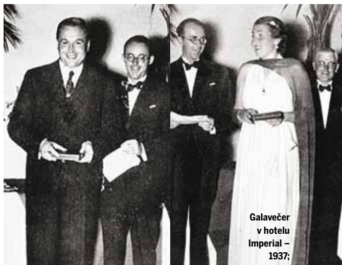
Galavečer v hotelu Imperial – 1937:

Poválečná transformace golfu nebyla rychlým ani jednoduchým procesem. Na trase mezi Prahou a Karlovými Vary dál o víkendech putovaly celé golfové rodiny, jejichž jména se v českém golfu změnila v pojmy –