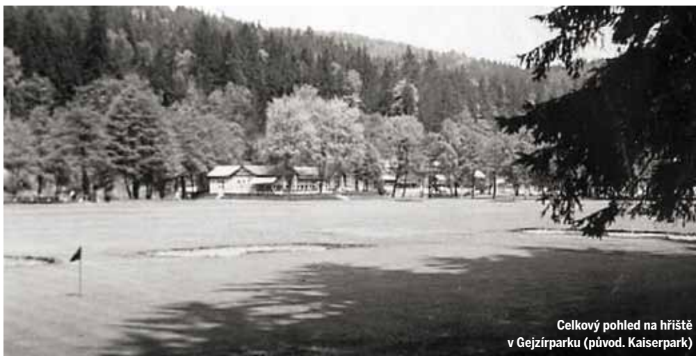
Celkový pohled na hřiště v Gejzírparku (původ. Kaiserpark)

Lídrem regionu byl během dvacátých a první poloviny třicátých let karlovarský golf. Mariánské Lázně pak převzaly po Piešťanech roli mezinárodního centra a postupně se staly i Mekkou českého golfu.