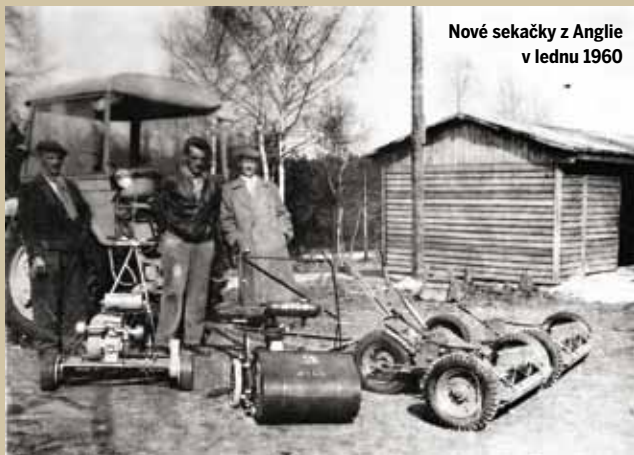
Nové sekačky z Anglie v lednu 1960