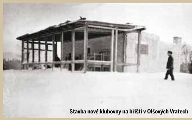
Stavba nové klubovny na hřišti v Olšových Vratech